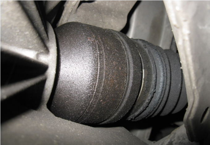
Vet- / oliesporen aan de linker, binnenste, homokineet