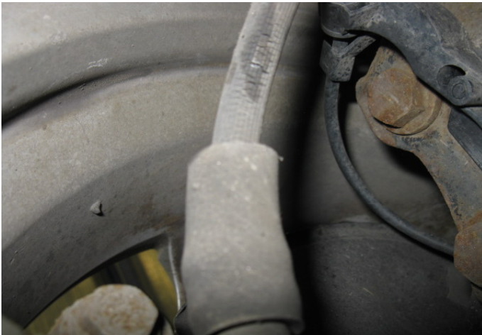
Droogtescheuren / wapeningsmateriaal zichtbaar, remslangen aan de voorzijde