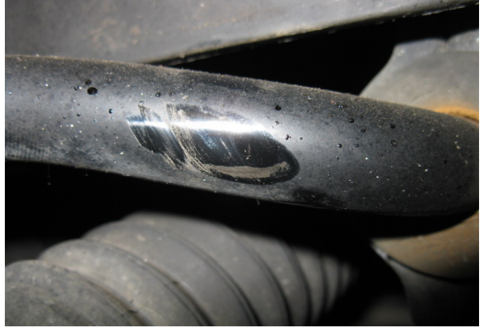
Schuursporen aan stabilisatorstang, wiel rechtsvoor