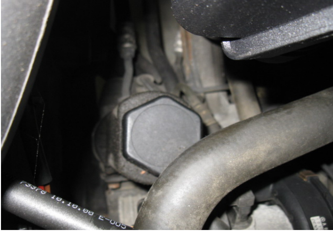
Vet- / oliesporen aan stuurbekrachtigingsreservoir